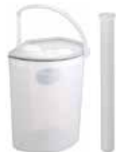
尿タンク・ブラシ入れが 付属します。