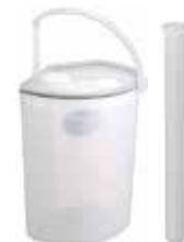
尿タンク・ブラシ入れが 付属します。